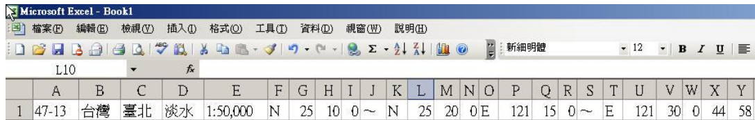
圖 1、原始 CSV 檔格式

1.開啟 CSV 檔，將坐標範圍輸入，以度、分、秒表示，範例格式如圖 1 表示。