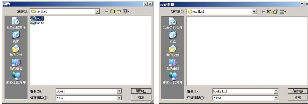
圖 3、開啟檔案及存檔